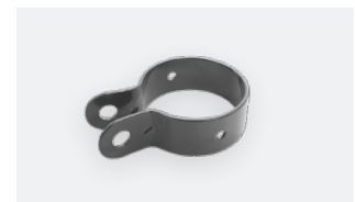
P.58 - Collier Dovigraf