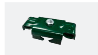
P.58 - Fixation pour grillage rigide