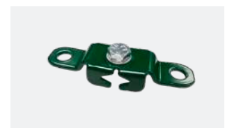
P.58 - Fixation pour fil de tension et raidisseur