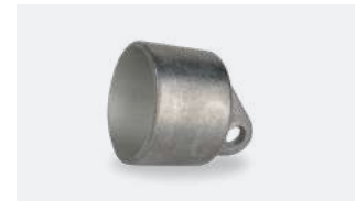
P.58 - Embout pour JDF Dovigraf